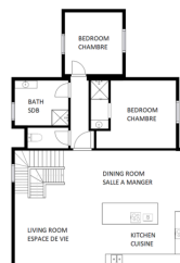
1st FLOOR 1er ETAGE