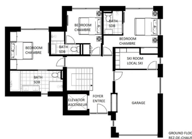
GROUND FLOOR REZ-DE-CHAUSSEE