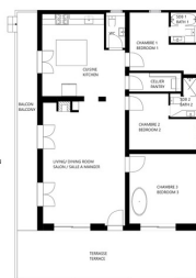
CHALET NANTAUX - 1er ETAGE - PLAN CHALET NANTAUX - 1st FLOOR - FLOOR PLAN