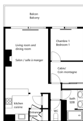
APARTMENT MORZENA - FLOOR PLAN APARTMENT MORZENA - PLAN